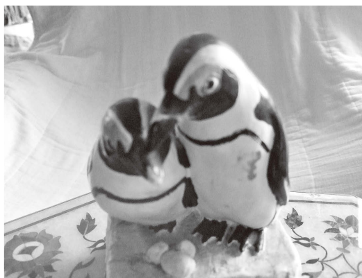
シェリントンのペンギン エックルスがオックス フォード大学を去るにあ たって、シェリントンが 銭別として贈ったと伝え られている陶器のペンギ ン像。シェリントンがこ のような贈り物をしたの は珍しく、エックルスも 気に入って愛蔵していた という。

確かに、同じことを考え続けていると、どこかで無意識になっちゃうね。それで、自分では忘れてはいるけれども、2~3日経ってからヒョッと思い出すよね。「ああ、あ